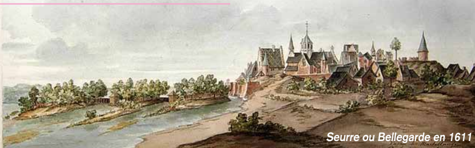
Seurre ou Bellegarde en 1611

A u XIII e siècle, en février 1245 exactement, Hugues 1 er d'Antigny et de Vienne, Seigneur de Pagny, affranchit les habitants de la Ville de Seurre. En mai 1278, la grande charte d'affranchissement est proclamée dans l'église, par le bailli, devant le maire, les échevins et la population ; cette charte est achetée à leur seigneur par les habitants au prix de 4000 livres, une somme considérable pour l'époque.